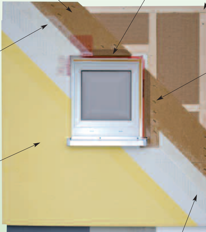
Unterkonstruktion, z. B. Holzrahmenbau oder Holzmassivbauweise