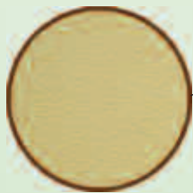
Baumit NanoporPutz Baumit SilikonPutz Baumit SilikatPutz