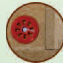
Baumit HolzDübel 6 H für Holzrahmenbau und Vollholzuntergrund